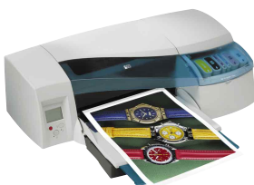
imprimante hp designjet 10ps