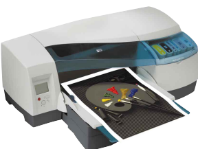
imprimante hp designjet 20ps